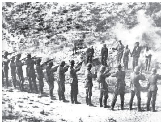
Tyska trupper utför en av många masslikvideringar på östfronten.

Polisorganisationen inom Nazityskland blev till sist gigantisk och vid krigsutbrottet 1939 skulle organisationen växa ännu mer. I varje ockuperat land sattes en stor polisstyrka upp, enligt samma mönster som i Tyskland, med säkerhetspolis, kriminalpolis, ordningspolis osv. Brutaliteten i de ockuperade länderna skulle bli betydligt värre än i Tyskland. I de mobila likvidationsförbanden, kända som Einsatzgruppen , deltog en rad poliser ur ordningspolisen, kriminalpolisen, SD och soldater ur Waffen-SS. Faktum är att majoriteten av medlemmarna i dessa mördarskvadroner kom från den reguljära polisen. Till